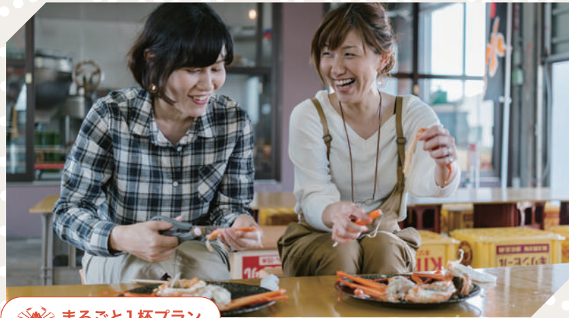
🍷 まるごと1杯プラン

全国的にも珍しい昼セリの見学に加え、新湊漁港で水揚げされたばかりの紅ガニ(ベニズワイガニ)を新湊かに小屋で食べることができます。